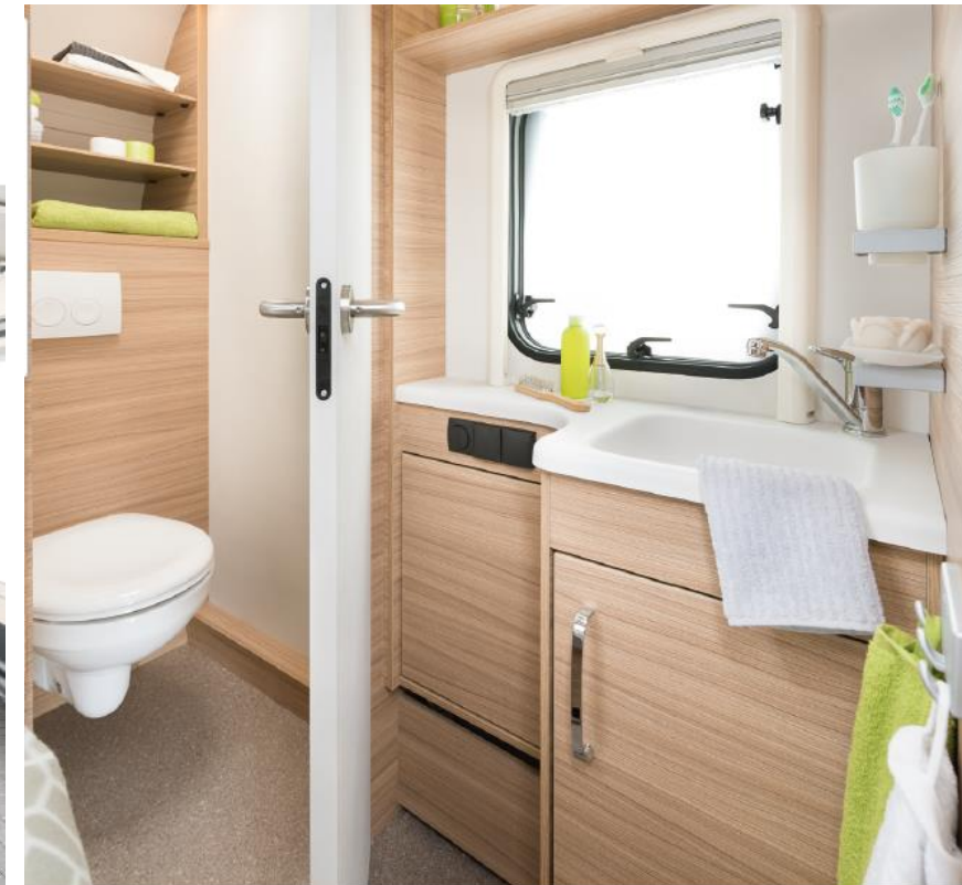
+ Haushaltsübliche Keramik-Hängetoilette angeschlossen an das Abwassersystem. Es sind hochwertige, haushaltsübliche Armaturen verbaut