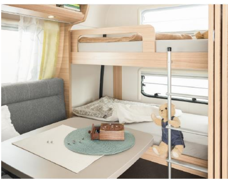
+ Die Kinder schlafen im Heck längs (wie Abb. Season Camper L) oder quer (Season Camper M), ungestört vom Elternschlafzimmer