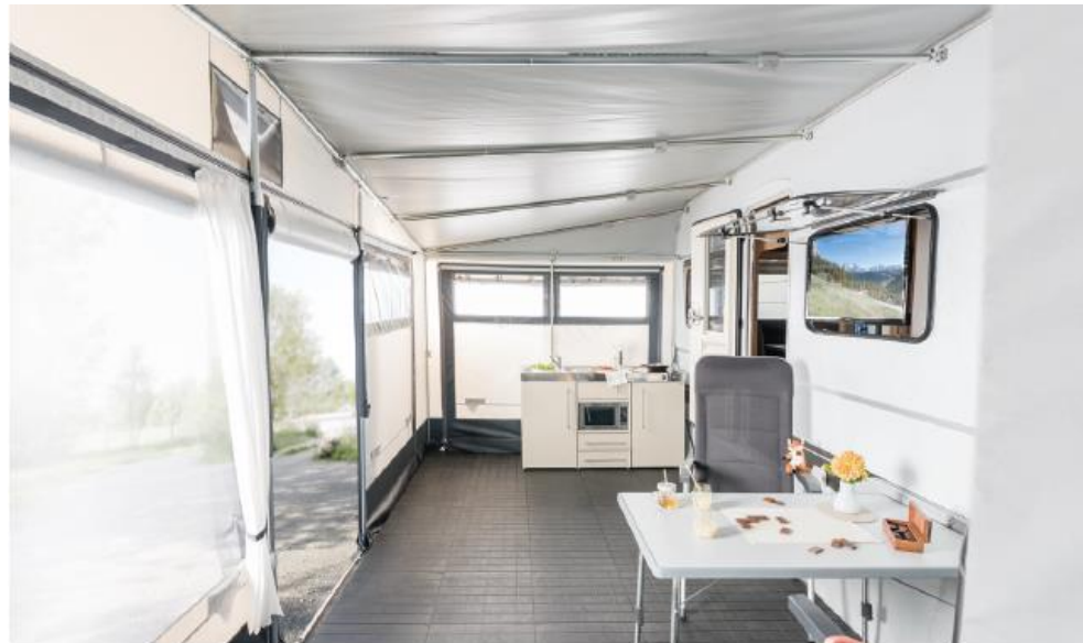
+ Küche (alternative Küchenmodule verfügbar)