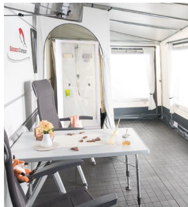
+ Duschkabine im Vorzelt, die sich diskret in einem separaten Umkleideabteil befindet