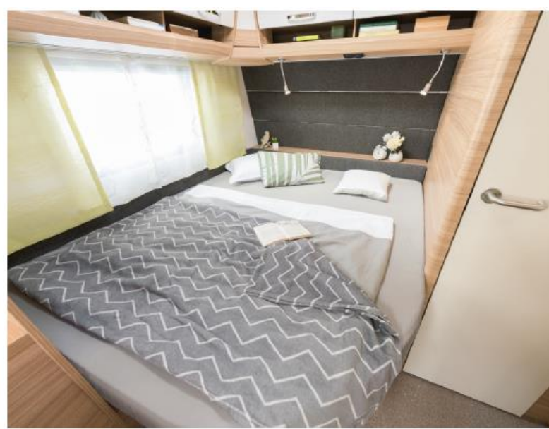
+ Im großen Doppelbett warten erholsame und ruhige Träume auf die Eltern